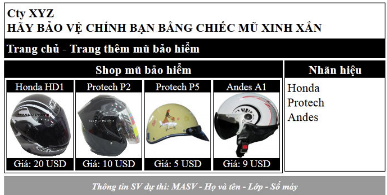
Hình 3: Trang chủ (index.php)

Câu 4: (4 điểm) Xây dựng trang thêm mũ bảo hiểm (đặt tên trang là insert.php) với giao diện được kế thừa từ cấu trúc CSS được tạo ở câu 2: