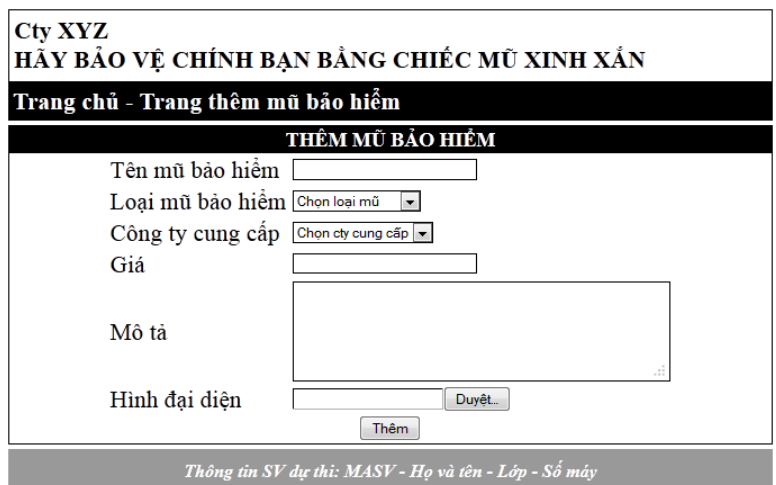
Hình 4: Trang thêm sản phẩm